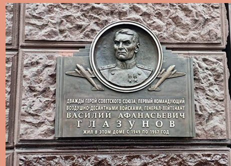
Мемориальная доска дважды Герою Советского Союза В.А. Глазунову. Москва, Ленинградский пр-т, открыта 8 мая 2023 г

Родился 1 января 1896 года в д. Варваровке Чубаровской волости Сердобского уезда Саратовской губернии (в настоящее время Колышлейский район Пензенской области) в семье крестьянина. В августе 1915 года был призван в ряды Русской императорской армии. С февраля 1916 года принимал участие в боевых действиях на Юго-Западном фронте, в том числе в Брусиловском прорыве и боях в районе г. Броды. В феврале 1918 года был демобилизован из рядов армии в чине младшего унтер-офицера. В июле 1918 года был призван в ряды РККА и направлен в резерв комсостава при Покровско-Туркестанском полку, дислоцированном в Покровской волости Новоузенского уезда Самарской губернии (в настоящее время Энгельсский МР Саратовской области). Во время Великой Отечественной войны генерал-майор Глазунов руководил формированием десяти воздушно-десантных корпусов и пяти бригад, а также их подготовкой к боевым действиям. Под руководством Глазунова с января по февраль 1942 года была подготовлена и проведена