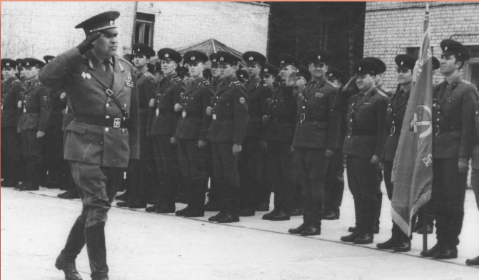
Проводы перед строем 10-й ракетной дивизии при Боевом знамени. Кострома. 1976 г