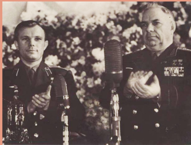
Командующий войсками Московского военного округа, генерал армии Н.И. Крылов на чествовании первого космонавта Ю.А. Гагарина, 14 апреля 1961 г.

Родился 29 апреля 1903 года в с. Гуляевка Саратовской губернии (в настоящее время Вишнёвое Тамалинского района Пензенской области) в семье сельского учителя. В возрасте 16 лет был зачислен добровольцем в Красную Армию. В 1920 году, после окончания Саратовских пехотно-пулеметных курсов, назначен командиром стрелкового взвода, затем стрелковой полуроты в составе 28-й стрелковой дивизии. Участвовал в Гражданской войне, а после продолжил служить на Дальнем Востоке. В годы Великой Отечественной войны сражался на Южном, Северо-Кавказском, Сталинградском, Донском, Юго-Западном, Западном, 3-м Белорусском и 1-м Дальневосточном