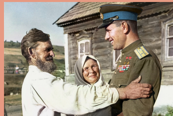
Николай Скоморохов с родителями. Возвращение в родное село Лапоть Саратовской области. 1946 год

Дважды Герой Советского Союза Николай Михайлович Скоморохов родился 19 мая 1920 г. в с. Лапоть (в настоящее время – с. Белогорское) Саратовской губернии в семье крестьянина. С 1930 г. проживал в Астрахани. С ноября 1942 г. сержант Н.М. Скоморохов в действующей армии. По апрель 1944 г. служил в 164-ом ИАП; по май 1945 г. – в 31-ом ИАП. Воевал на Закавказском, Северо-Кавказском, Юго-Западном и 3-ем Украинском фронтах. Летал на истребителях ЛаГГ-3, Ла-5, Ла-5ФН и Ла-7. Всего за годы войны совершил более 605 боевых вылетов, провел 143 воздушных боя, лично сбил 46 самолетов противника и еще 8 – в составе группы, 3 самолета были им уничтожены на земле. В ходе штурмовок уничтожил 11 автомашин, 13 повозок с боеприпасами, склад с горючим, 9 железнодорожных вагонов. За время боевых вылетов сам Скоморохов ни разу не был ранен, его самолет не горел, не был сбит и за всю войну не получил ни одной пробоины.