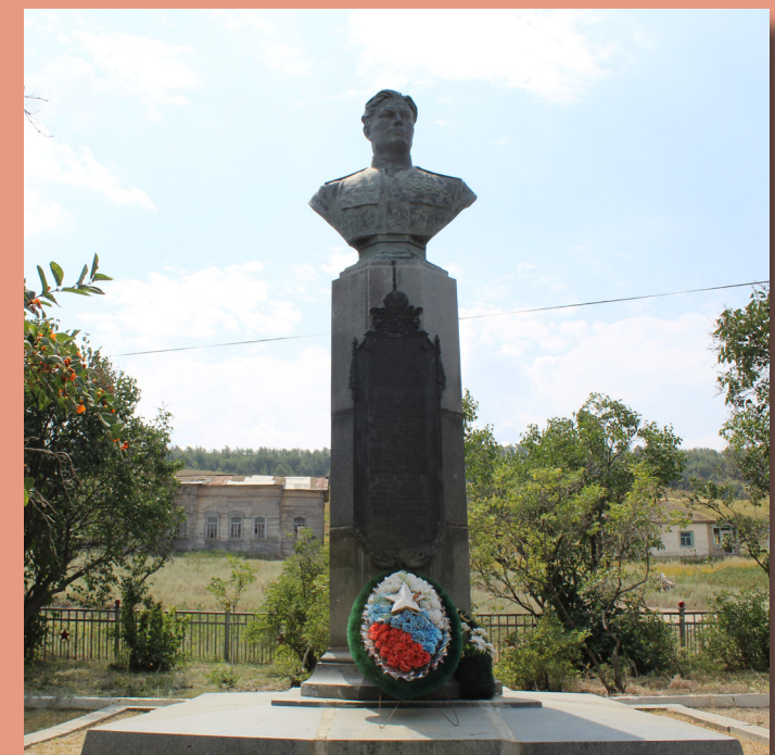
Бюст дважды Героя Советского Союза Н.М. Скоморохова на Родине