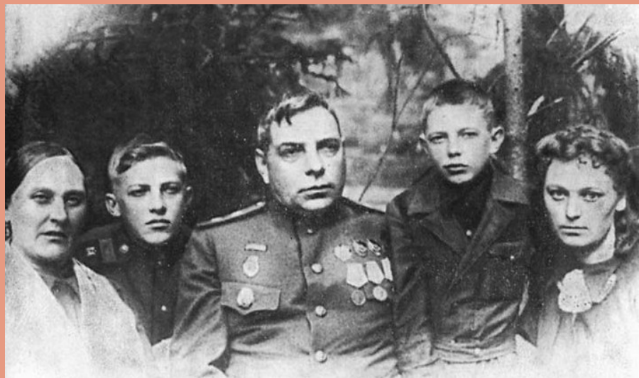
Н.И. Крылов с семьей, май 1943 г. Н.И. Крылов с семьей, май 1943 г.

фронтах. Принимал участие в обороне Одессы, Севастополя, в Сталинградской битве, освобождении Белоруссии, Литвы, разгроме врага на территории Восточной Пруссии и Маньчжурии. В декабре 1941 года был тяжело ранен. С сентября 1942 года Крылов – начальник штаба 62-й армии, которая вела многомесячные уличные бои в Сталинграде. До прибытия нового командующего В.И. Чуйкова почти месяц руководил армией. В сентябре 1943 года Крылову было присвоено воинское звание генерал-лейтенанта, а в октябре того же года он был назначен командующим 5-й армией на Западном фронте. За личное мужество и умелое руководство войсками армии в период Белорусской наступательной операции звание Героя Советского Союза с вручением медали «Золотая звезда» и ордена Ленина Николаю Ивановичу Крылову было присвоено 19 апреля 1945 года. После победы над Германией 5-я армия была переброшена на Дальний Восток и включена